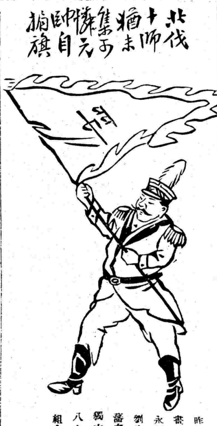
昨日書以永州劉建藩之八字組合